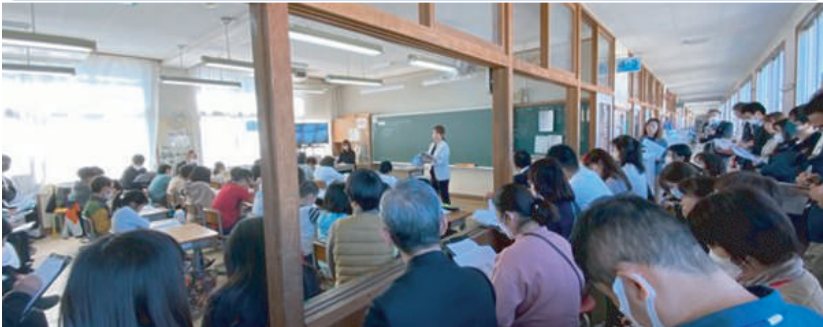
(第53回 大分県「小道研」授業研究会の様子)