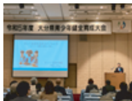
(サイバー犯罪の現状報告)