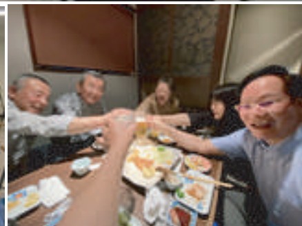
(楽しかった懇親会)